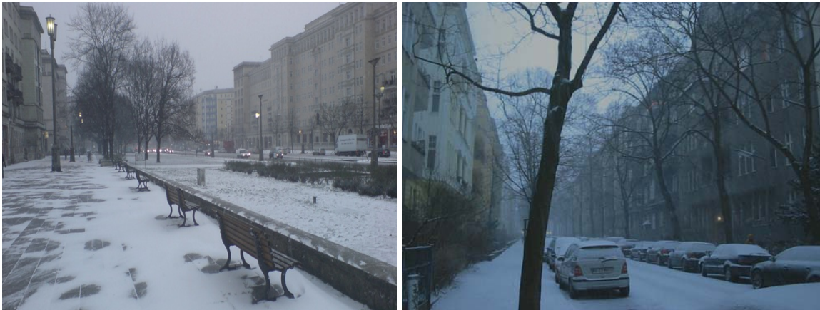
Jeder kennt ihn, keiner will ihn: Berliner Winter

Auch stellt sich der Hauptstädter zu Recht die Frage, ob etwas so langwieriges und beständiges wie der Winter überhaupt noch zeitgemäß ist. Man ist es gewohnt schnell zu essen, schnell zu laufen, schnell zu sprechen. Und dann soll man sich monatelang mit einer miesen Jahreszeit herumschlagen?